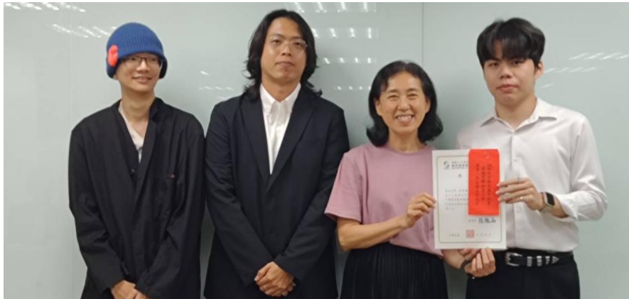
臺北大學 榮獲期末報告比賽第三名