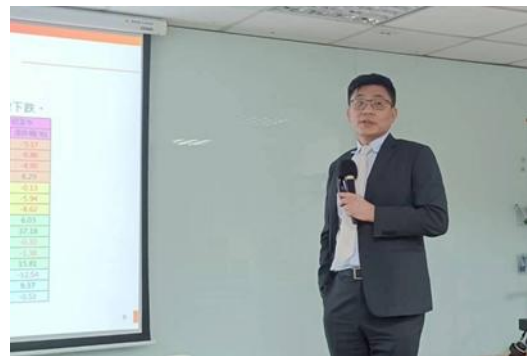
邀請統一投顧黎方國董事長 主講:國際經濟金融情勢分析