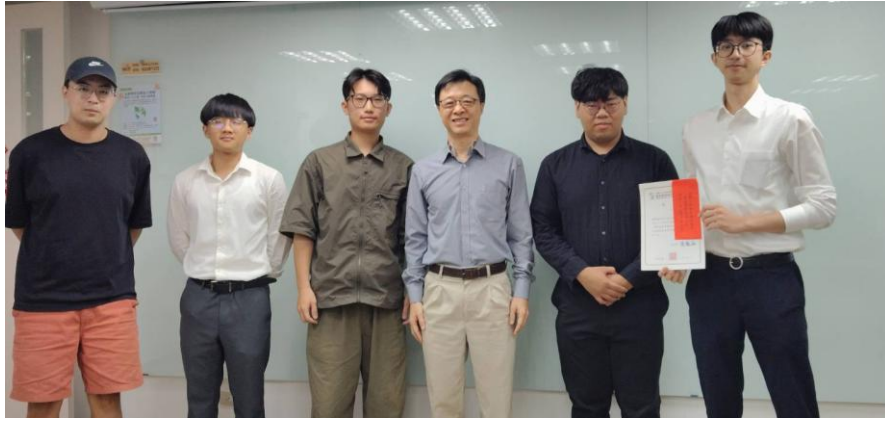
臺灣師範大學 榮獲期末報告比賽第二名