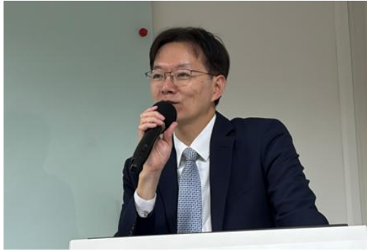
邀請證券期貨局黃仲豪副局長 主講:打造創新多元的資本市場