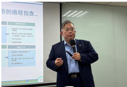
邀請富邦投信黃昭棠董事長 主講:ETF 市場介紹與發展趨勢